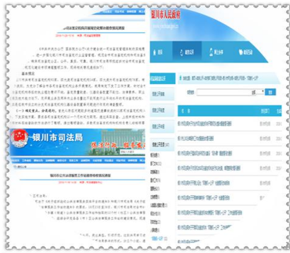
银川市司法局 2018 年“双随机一公开”情况通报

机构清理整顿活动、全市司法鉴定机构规范化整治督查、全市五星级司法所规范化建设“回头看”督查和全市公共法律服务工作站（室）督查验收等专项督查检查活动，并将督查