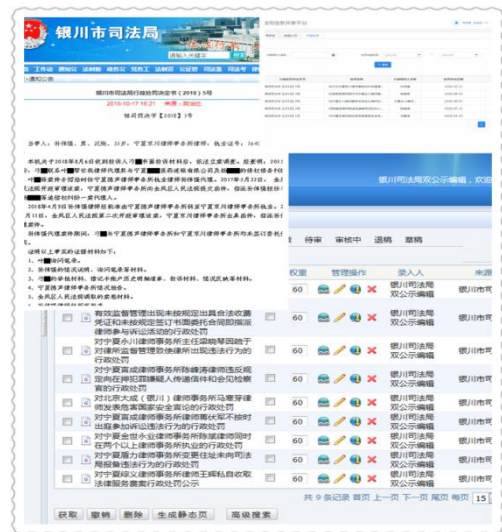
银川市司法局 2018 年行政处罚公示

通报及时在银川市人民政府门户网站、银川市司法局网站进行公开，切实规范了全市司法行政执法规范化水平，提高了司法行政执法公信力。三是严格按照财政预决算相关要求，做好财政资金和预决算公开工作，及时、准确、全面的主动公开了《银川市司法局 2017 年部门决算公开说明》、《银川市司法局 2018 年部门预算公开说明》、《银川仲裁委员会办公室 2017 年部门决算公开说明》和《银川仲裁委员会办公室 2018 年部门预算公开说明》，真正做到了财政信息公开透明化、细致化，进一步保障人民群众的知情权、参与权和监督权。四是全面落实行政许可与行政处罚“双公示”制度，严格按照相关要求，将 2018 年银川市