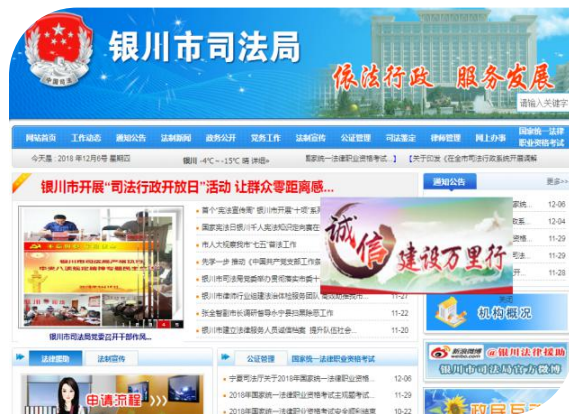
银川市司法局网站截图

2018 年，银川市司法局认真贯彻习近平新时代中国特色社会主义思想和党的十九大精神，全面落实自治区、银川市关于全面推进政务公开安排部署，始终坚持把政务公开作为促进法治政府建设和党风廉政建设的一项重要