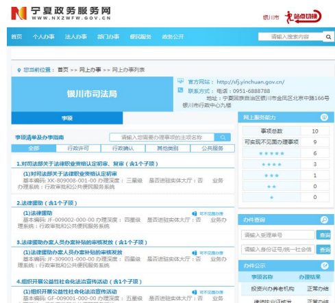
银川市司法局 10 项政务服务事项

（三）有序开展政务服务公开。 严格按照《银川市人民政府办公厅关于印发〈加快推进“互联网+政务服务”工作方案〉的通知》要求，梳理完善了涉及法治宣传、法律援助和国家统一法律职业资格证书共 10 项政务服务事项，并在银川市政府门户网站网上办事栏目和银川市司法局网站网上办事栏目准确、全面公开了服务内容，进一步推进了司法行政政务服务工作便民有效。