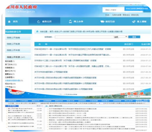
银川市司法局 2018 年人大代表建议和政协提案办理情况

2018 年，银川市司法局进一步明确办理任务，及时定岗定责，切实做好人大代表建议和政协委员提案办理结果公开工作，严格按照市委、政府督查室要求的时间节点，于