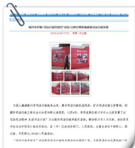
银川市司法局 2018 年“政府开放日”信息

市中山公园结合第五个“国家宪法日”和“法润银川”宪法知识定向赛活动，组织开展了以“弘扬宪法精神 走进司法行政”为主题的司法行政“政府开放日”活动。活动邀请了银川市人大代表、