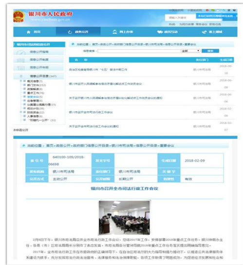
银川市司法局 2018 年重要会议信息

（一）强化行政决策公开意识。 一是积极落实重大决策预公开制度，扩大公众参与，对涉及群众切身利益、需要社会广泛知晓的重大决策事项，除依法应当保密的外，在决策前向社会公开相关信息，广泛听取公众意见，及时公开意见收集情况和采纳情况。截至年底，银川市司法局未制定出台重大决策事项。二是认真做好重要会议公开工作，对涉及公众利益、需要社会广泛知晓的“全市司法行政工作会议”、“全市人民调解参与信访矛盾纠纷化解试点工作”和“自治区督导检查银川市‘七五’普法中期工作”等重要会议，及时将会议相关信息通过银川市政府门户网站、银川市司法局网站、政务微博、微信进行了公开，切实保障了人民群众的知情权、参与权和监督权。