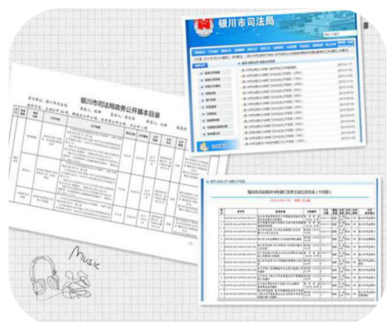
银川市司法局 2018 年政府信息主动公开目录

上报至银川市人民政府政务公开办公室，并按照要求统一在银川市人民政府门户网站和银川市司法局网站予以公开。同时健全完善