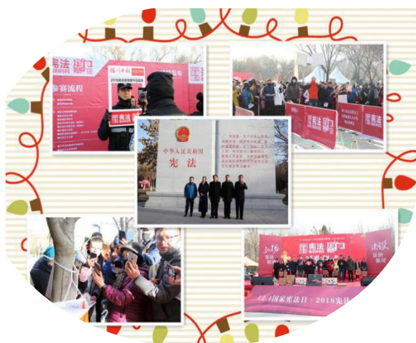
银川市司法局 2018 年“政府开放日”活动图片

政协委员、市依法治市领导小组成员单位、县（市）区政府各部门、人民团体、企事业单位干部职工、媒体记者和市民群众 1000 余人踊跃参加，将司法行政开放工作同宪法知识普及和时下新兴的定向越野体育运动相结合，向群众进行近