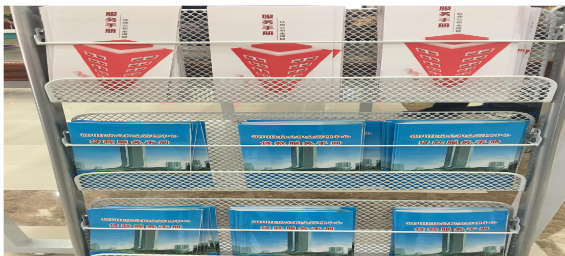
(图一 银川住房公积金服务大厅业务宣传手册)