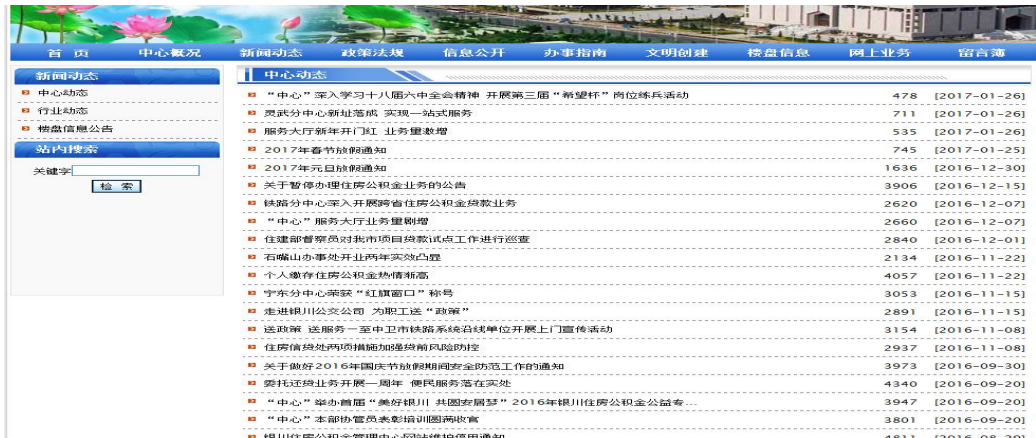
(图三 银川住房公积金官网的信息公开版块)

站上答复职工咨询 975 条，网站的宣传作用明显提升。进一步加强公积金微博建设，累计发布微博 5541 条，共有粉丝 14439 人。